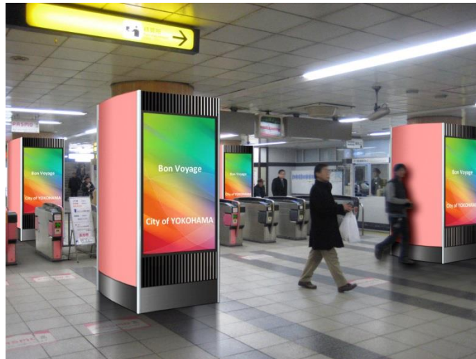
【側面全面シートセット 掲出イメージ】