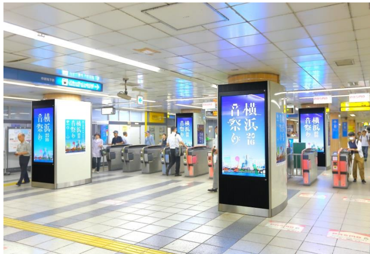
【側面ポスターセット 掲出イメージ】

横浜市営地下鉄で初のデジタルサイネージ媒体誕生！！ 改札へ向かう利用客の導線垂直に広告面が見えるため、非常に視認性の高い媒体です。デジタルサイネージ放映と、側面へのB1ポスター・全面シート貼掲出により、強力な情報発信ができます。